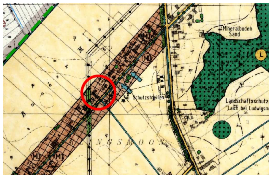
Abb. 4: Wirksamer Flächennutzungsplan der Gemeinde Königsmoos mit Kennzeichnung des Plangebiets, o.M.

Der Planbereich liegt innerhalb eines Dorfgebiets, am Übergang in die landwirtschaftlich geprägte Feldflur. Der Planumgriff liegt innerhalb der ausgewiesenen Baufläche. Das Planvorhaben kann demnach aus dem wirksamen Flächennutzungsplan abgeleitet und entwickelt werden.