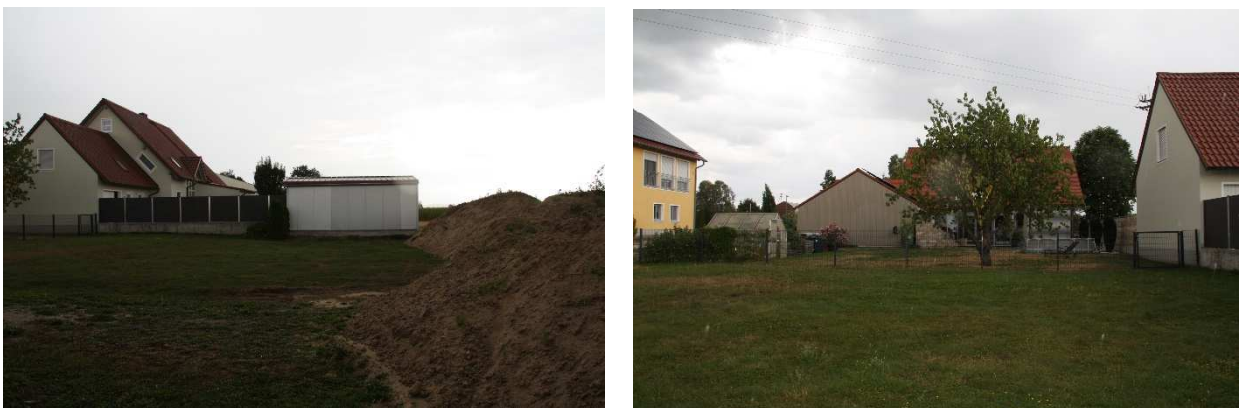
Abb. 2: Fotodokumentation – Standpunkt im Plangebiet, links: Blick Richtung Westen, rechts: Blick Richtung Süden

Das Plangebiet wird als private Grünfläche genutzt. Die Erschließung der Planfläche erfolgt ausgehend von der Straße „Erlengraben“ über das Grundstück mit der Fl.Nr. 179 Gemarkung Ludwigsmoos.