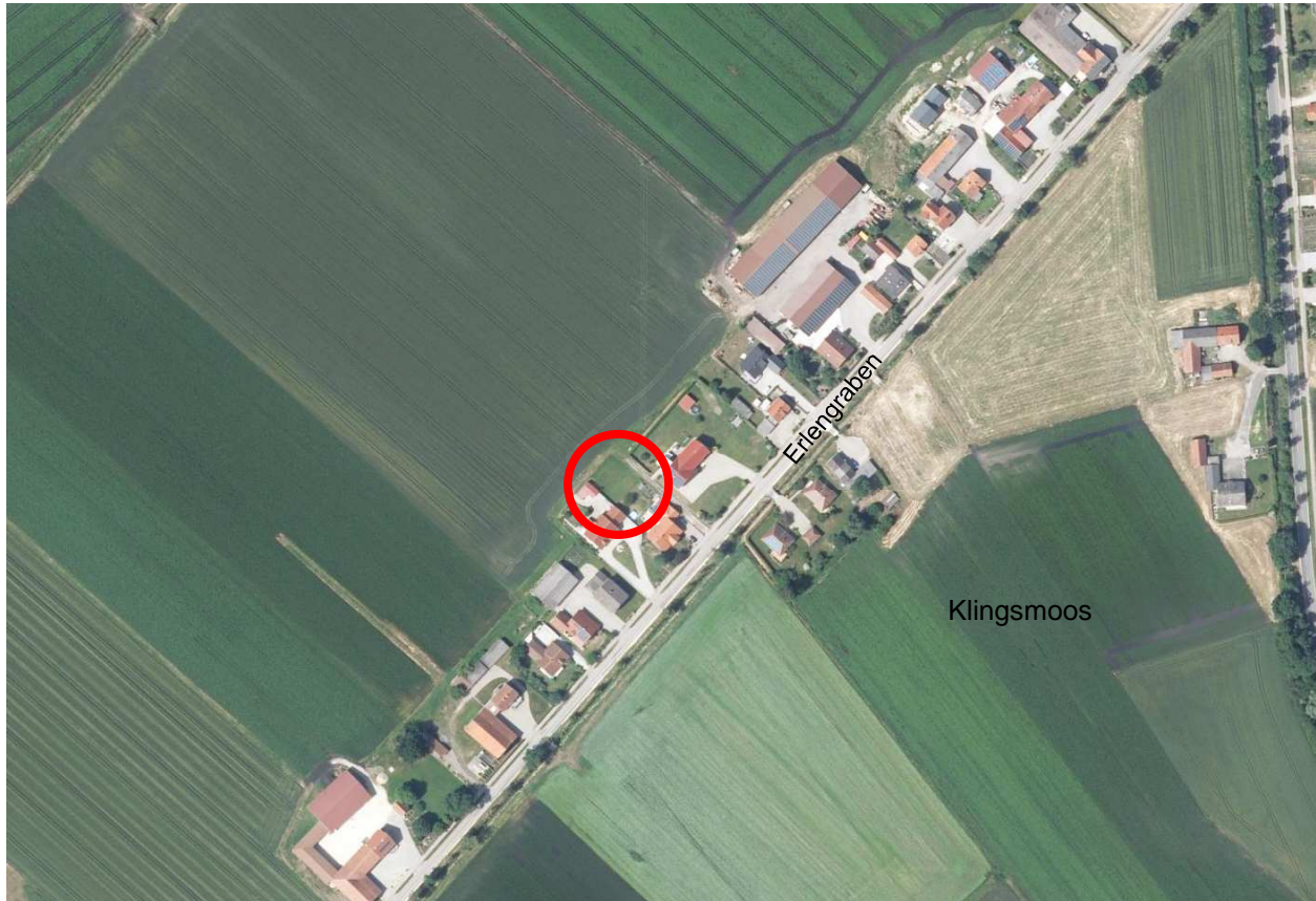
Abb. 1: Luftbild mit Kennzeichnung des Plangebiets, o.M.

Das Plangebiet liegt im Ortsteil Klingsmoos im rückwärtigen Bereich der Straße „Erlengraben“. Das Vorhaben ist zu drei Seiten von Bebauung umgeben. Im Norden folgt die offene Feldflur mit intensiv landwirtschaftlich genutzten Flächen.