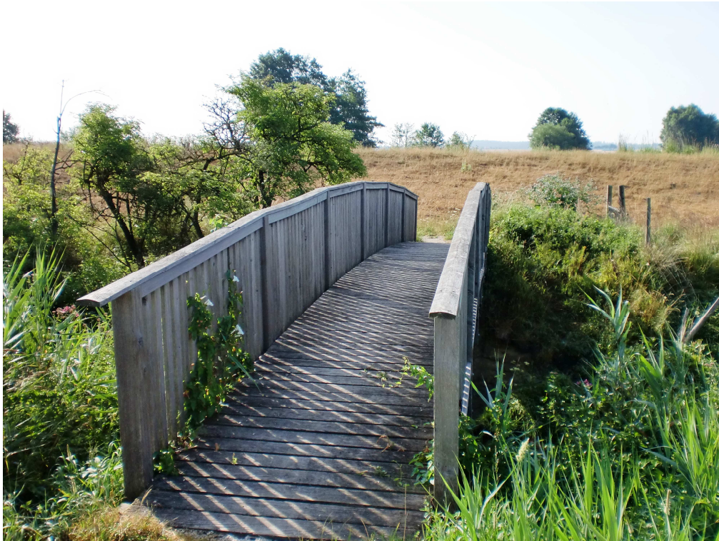
Holzsteg über Ach