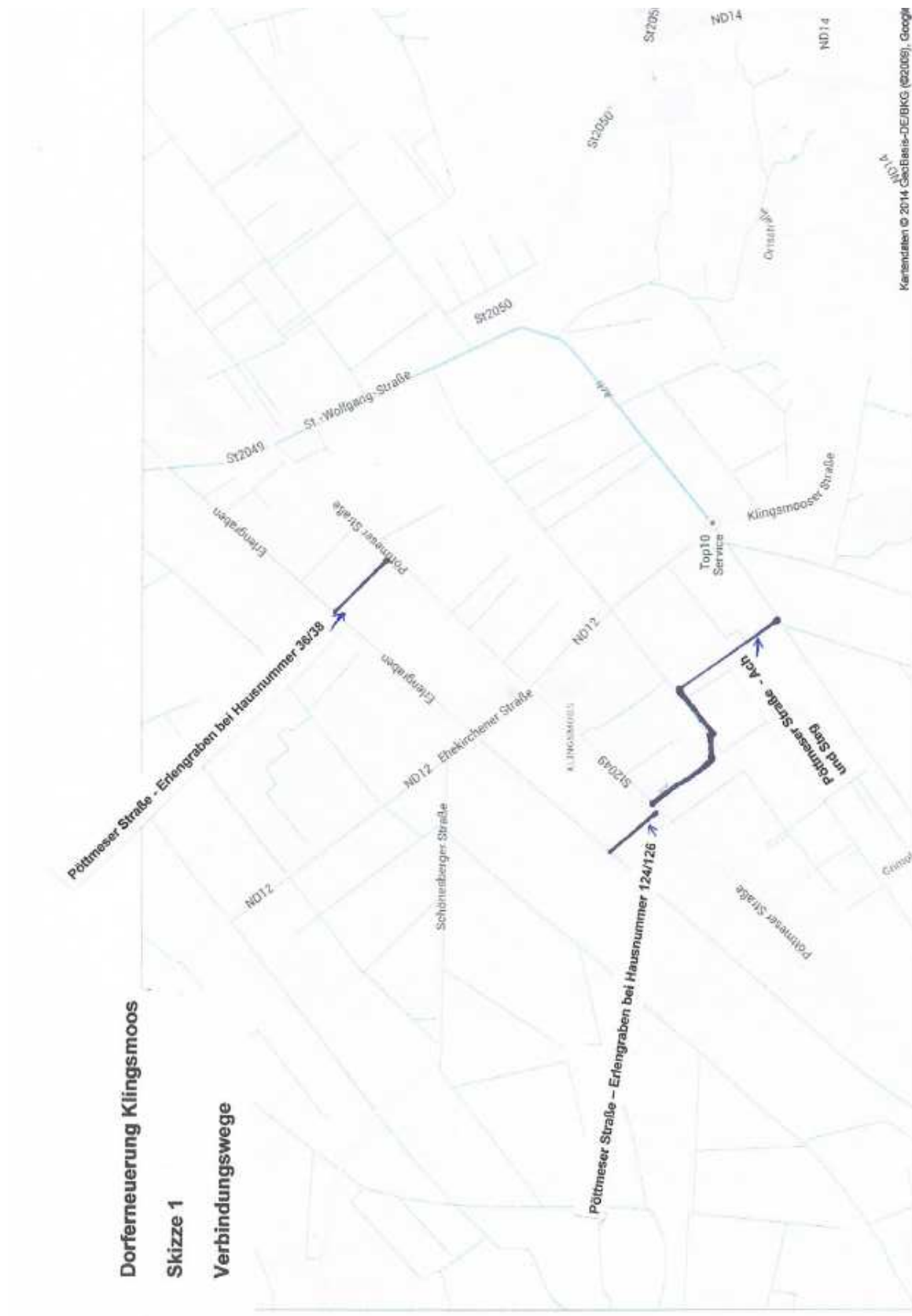
Dorferneuerung Klingsmoos Skizze 1 Verbindungswege