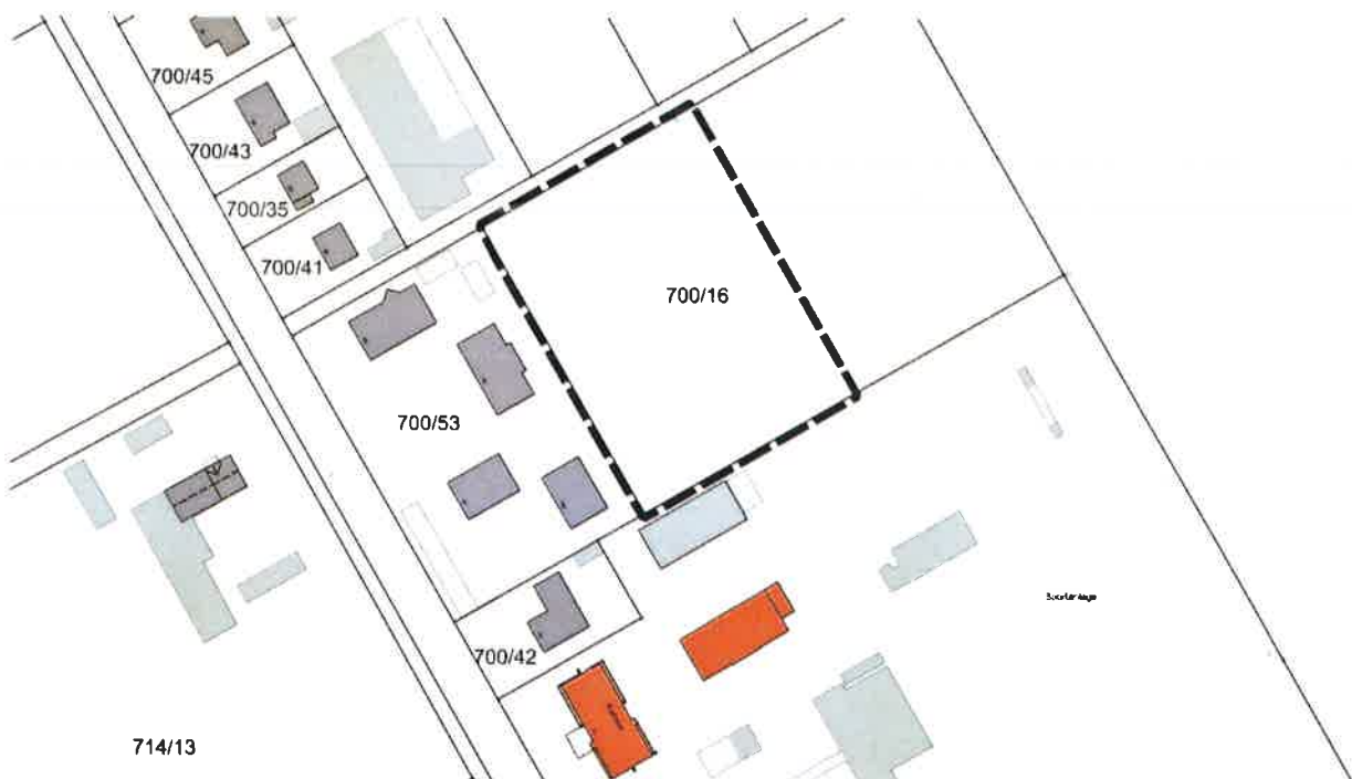
Lageplan des räumlichen Geltungsbereiches der 8. Änderung des Flächennutzungsplans, o. M., (Kartengrundlage Geobasisdaten © Bayerische Vermessungsverwaltung 2025)