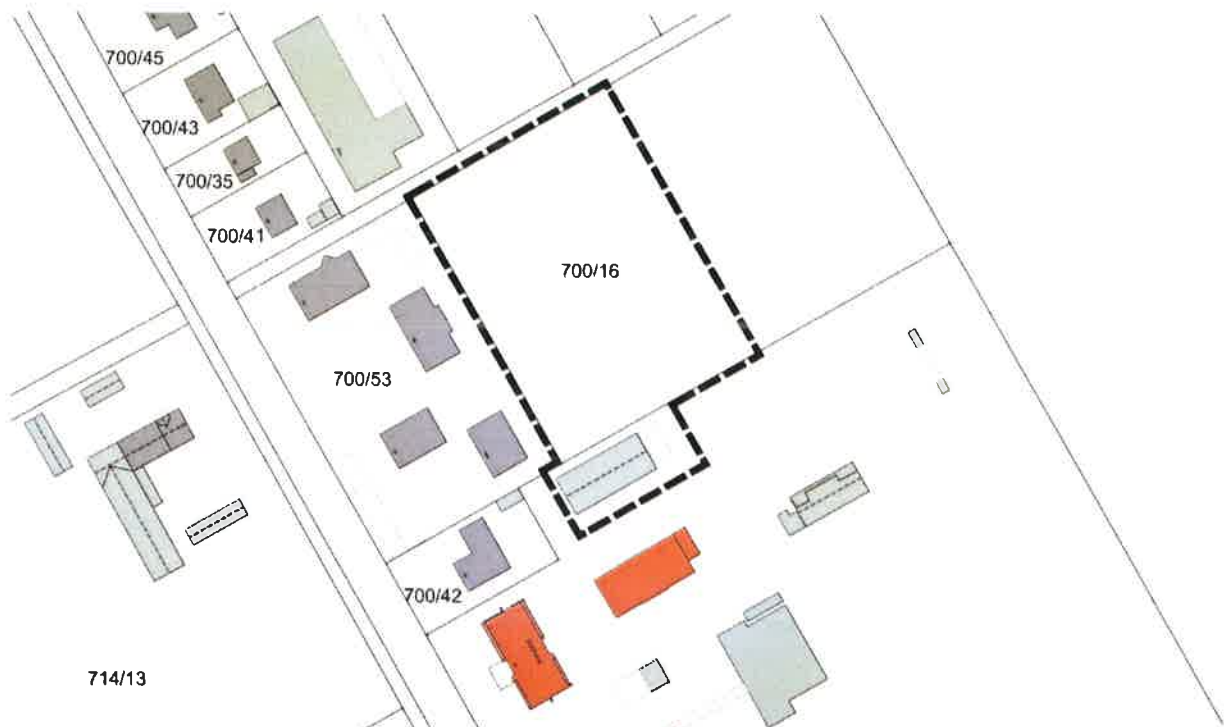
Lageplan des räumlichen Geltungsbereiches des Bebauungsplans Nr. 33 „Bauhofgelände“, o. M., (Kartengrundlage Geobasisdaten © Bayerische Vermessungsverwaltung 2025)