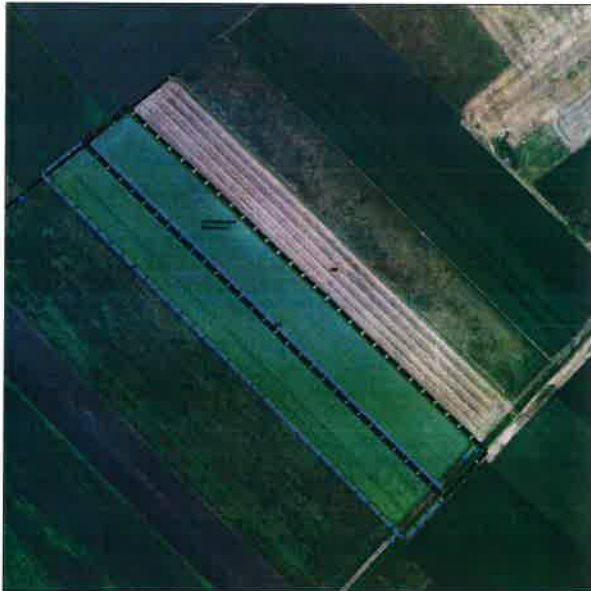
Lage externer CEF-Maßnahmen: Flurstück 332 (TF), Gemarkung Ludwigsmoos * ohne Maßstab

Lage externer CEF-Maßnahmen: Flurstücke 332 (TF), Gemarkung Ludwigsmoos