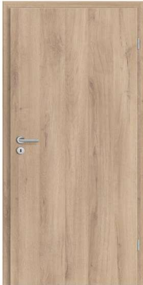
Sand Türen Kentucky Eiche rissig