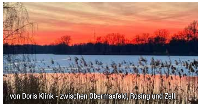
von Doris Klink - zwischen Obermaxfeld, Rosing und Zell