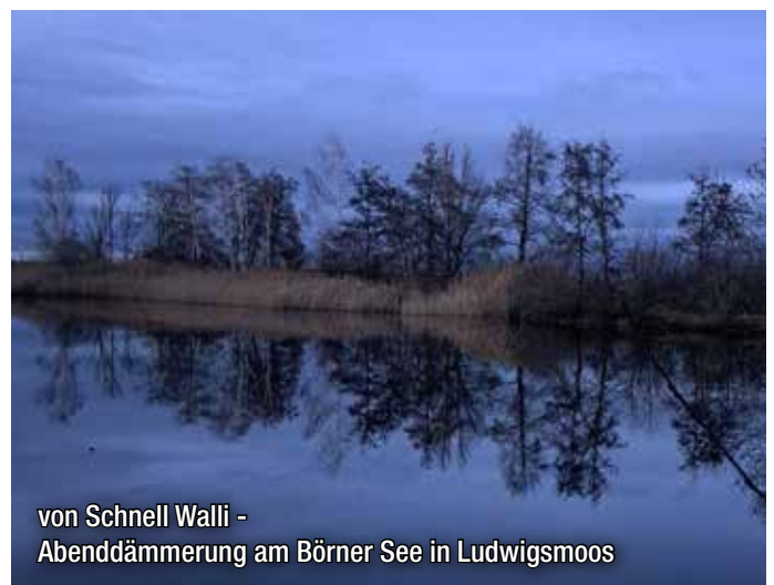
von Schnell Walli - Abenddämmerung am Börner See in Ludwigsmoos