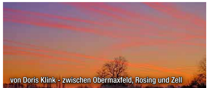
von Doris Klink - zwischen Obermaxfeld, Rosing und Zell

Wenn Sie uns die Bilder zusenden, stimmen Sie zu, dass die Fotos im Rahmen der Öffentlichkeitsarbeit der Gemeinde Königsmoos genutzt werden können.