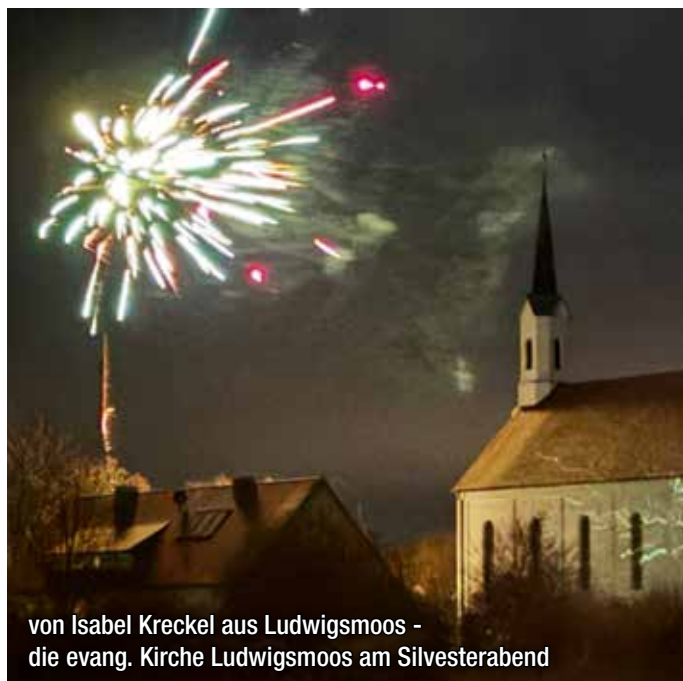
von Isabel Kreckel aus Ludwigsmoos - die evang. Kirche Ludwigsmoos am Silvesterabend