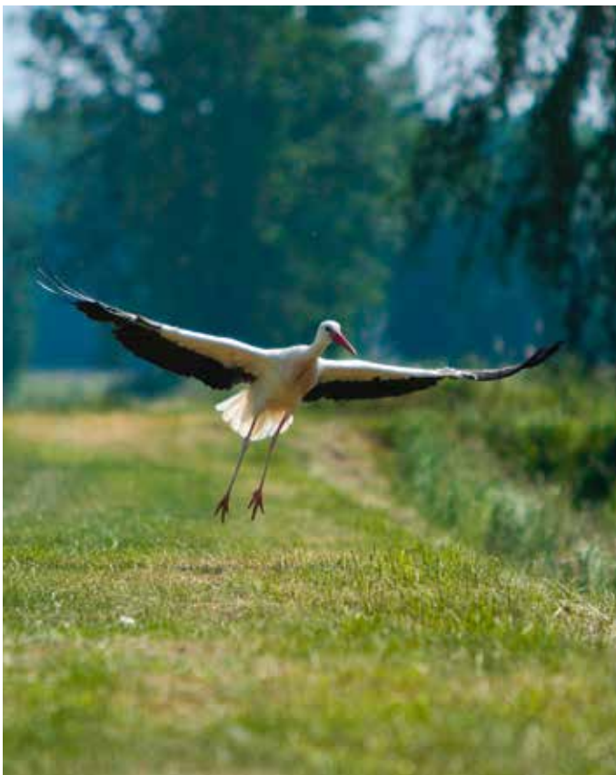
Störche in der Pöttmeser Str. von Carina Strobl

immer Ihren Namen, Wohnort und was auf dem Bild dargestellt ist, an. Bitte vermerken Sie dabei auch, falls die Veröffentlichung anonym erfolgen soll. Wenn Sie uns die Bilder zusenden, stimmen Sie zu, dass die Fotos im Rahmen der Öffentlichkeitsarbeit der Gemeinde Königsmoos genutzt werden können.