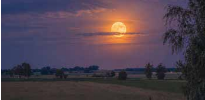
Der Mond in Ludwigsmoos von Gustav Richter