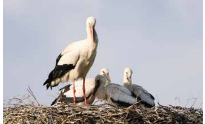
Wir haben wieder drei Jungstörche im Nest beim Pumpenhaus in Stengelheim. Auf den Fotos kann man die Altvögel noch gut von den Jungstörchen unterscheiden, da die „Alten“ jeweils rote Schnäbel und Füße haben.